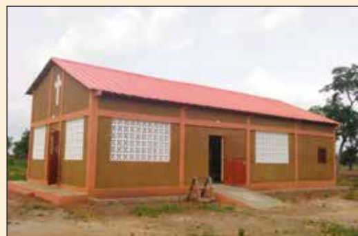
Chapelle de Gnimda Paroisse St François Xavier de Sotouboua (Diocèse de Sokodé)