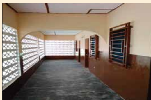
Couvent des Sœurs de Kazaboua (Diocèse de Sokodé)