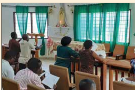
Prière du Rosaire dans la chapelle des OPM