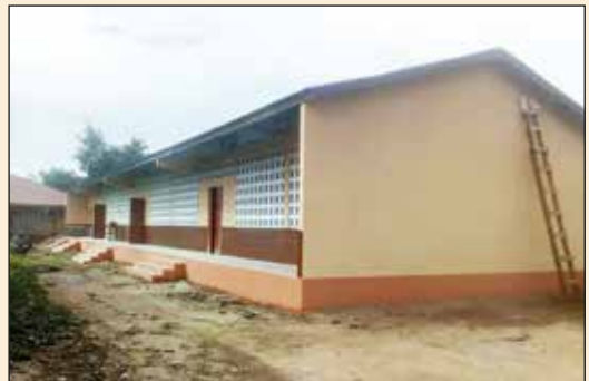
Nouveau bâtiment de l'Ecole Catholique d'AKATI (Diocèse de Kpalimé)