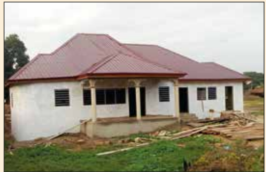
Presbytère, Paroisse Ste thérèse de Yokélé (Diocèse de Kpalimé)