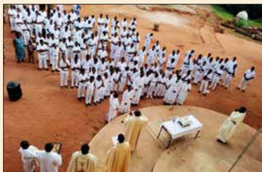
Petits Seminaristes de St Pie X (Archidiocèse de Lomé)