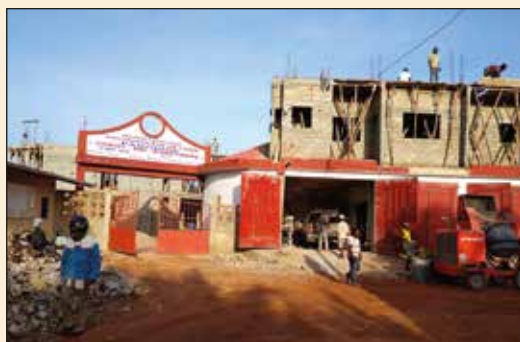
Chantier du presbytère de la paroisse Christ Roi d'Adétikopé (Archidiocèse de Lomé)