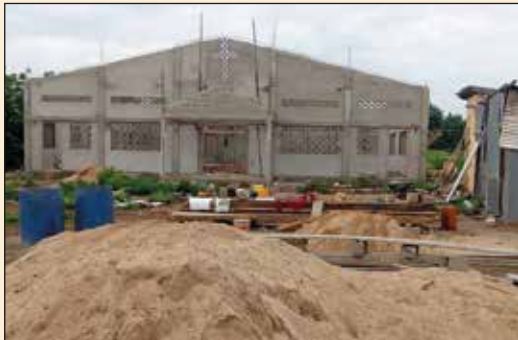
Chantier de la Paroisse N D de Lourde de Nano (Diocèse de Dapaong)