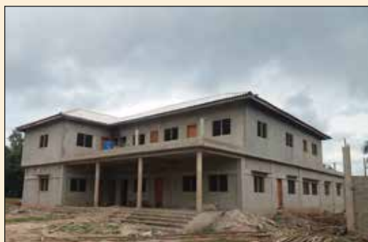
Chanrier Presbytère Paroisse de Zooti (Diocèse d'Aného)