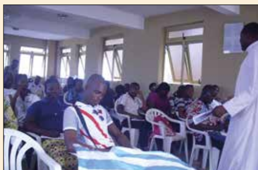
Formation des cathéchistes (Archidiocèse de Lomé)