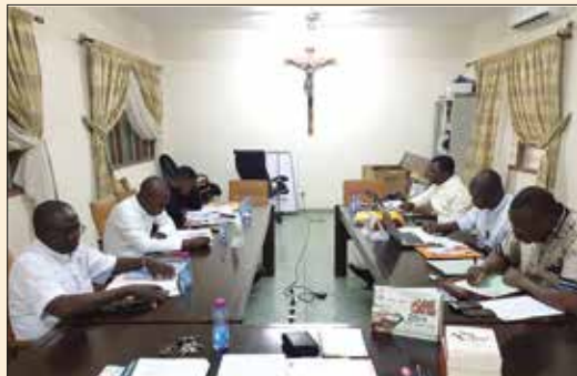
Réunion nationale des OPM Lomé, Sep. 2019