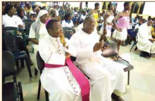
Le Directeur National et l'Evêque en charge des OPM