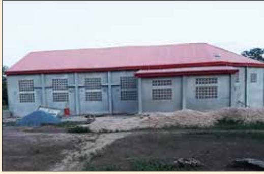
Eglise de Gamelili (Archidiocèse de Lomé)