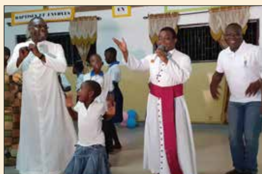
Activités de clôture du MME Octobre 2019