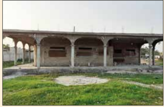
Presbytère de Kangnikopé (Archidiocèse de Lomé)