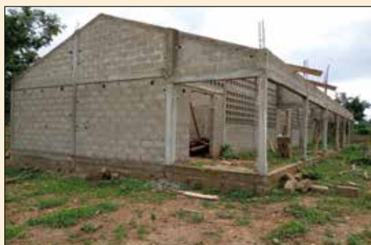
3 salles de classe de l'EPC-Tchawanda 2 Solidarité en chantier (Diocèse de Sokodé)