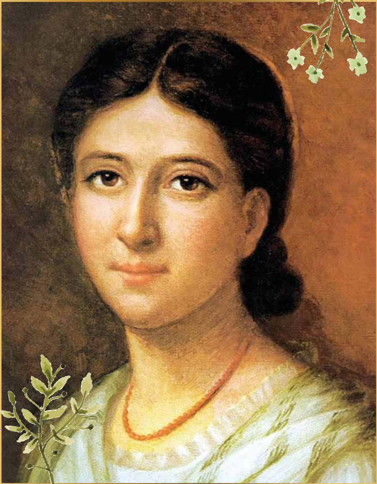
VENERABLE PAULINE MARIE JARICOT Bientôt bienheureuse