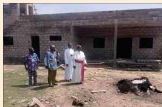
Visite du chantier du Presbytère Paroisse de Dagué (Diocèse d'Aného)