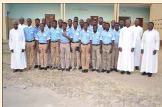
Elèves et formateurs du Petit Séminaire St Pierre Apôtre (Diocèse de Kara)