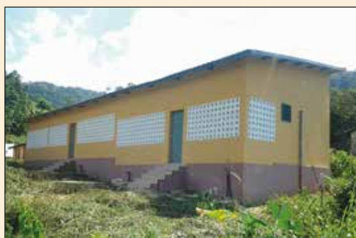
Logement des Soeurs à Badou (Diocèse d'Atakpamé)