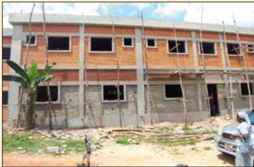
Nouveau couvent des soeurs de Notre Dame de Nazareth (Diocèse de Kpalimé)