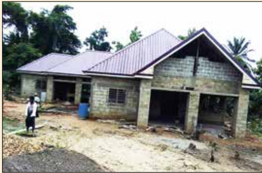
Presbytère, Paroisse Christ-Roi de Yéviépé (Diocèse de Kpalimé)