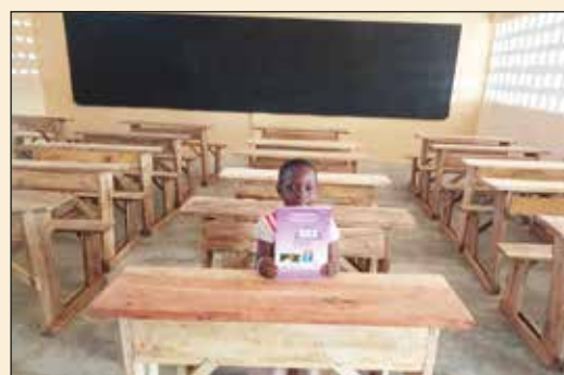
Ecole Primaire Catholique d'Afagnan (Diocèse d'Aného)