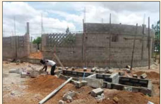
Chantier de la Paroisse N D de Lourde de Nano (Diocèse de Dapaong)