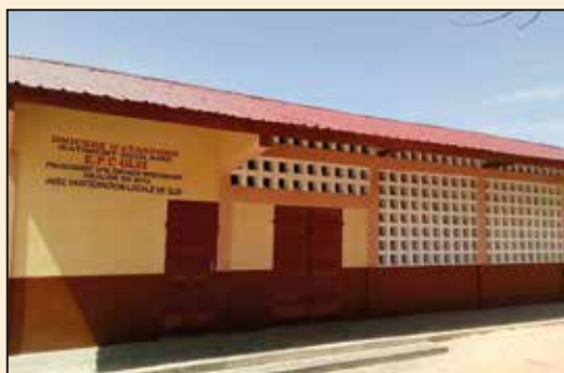
Ecole Primaire Catholique de Glei (Diocèse d'Atakpamé)