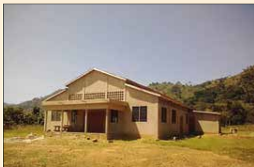
Eglise Sainte Thérèse d'Amlamé (Diocèse d'Atakpamé)