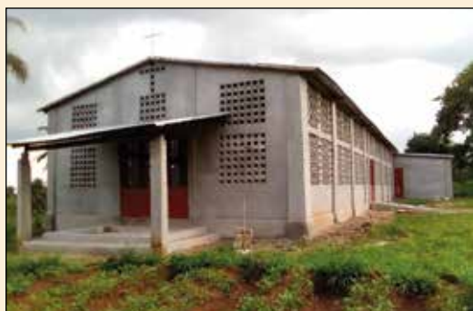
Eglise, Paroisse St François d'Assise de Bohou (Diocèse de Kara)