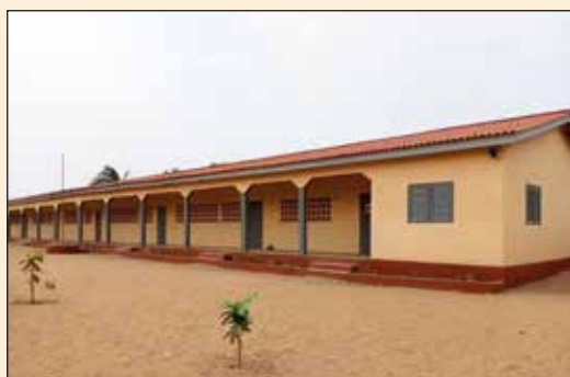
Ecole Primaire Catholique d'Afagnan (Diocèse d'Aného)