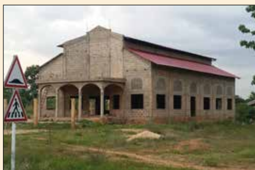
Eglise d'Imoussa, Paroisse de Okou (Diocèse d'Atakpamé)