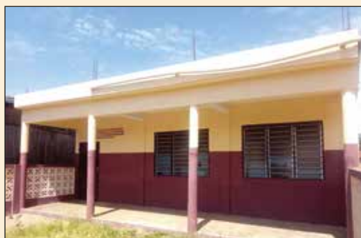
Jardin d'Enfants Ecole Primaire de KOEROMA (Diocèse d'Atakpamé)