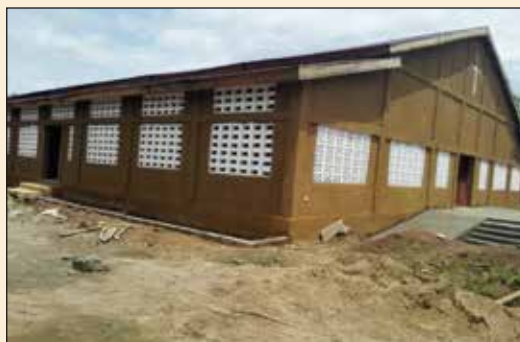
Eglise Notre Dame de Lorette de Goubi (Diocèse de Sokodé)