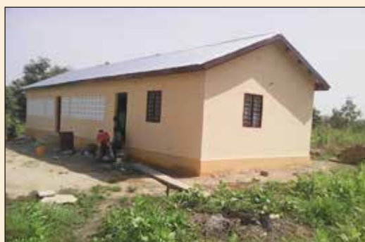
Presbytère, Kamina (Diocèse d'Atakpamé)