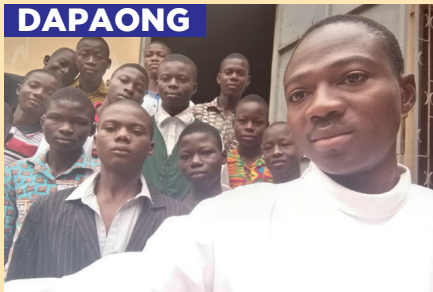
Petit séminaire Saint Clément / DAPAONG