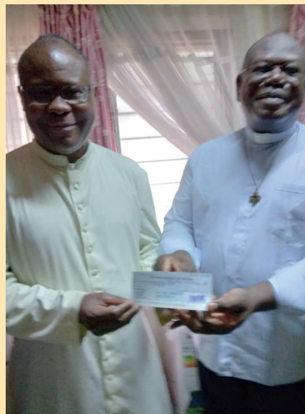
... par le Directeur National de l'Enseignement Catholique