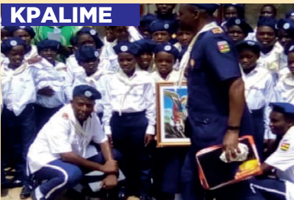
Photo de famille de la cérémonie d'engagement des CVAV de la Paroisse Saint Jean Paul II d'Agogo / KPALIME