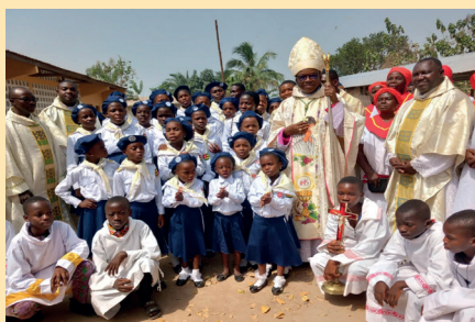
Célébration de la Journée Mondiale de l'Enfance Missionnaire à la Communauté Sainte Trinité de Bodze / KPALIME