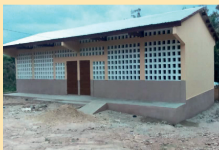
Ecole maternelle d'Agbo-Kpotamé / ATAKPAME