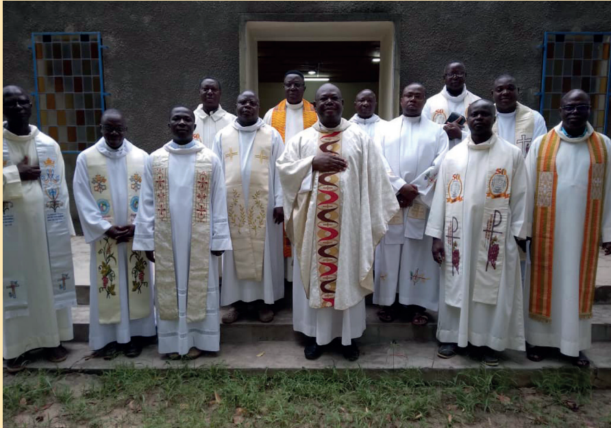
Photo de famille du réseau des OPM réuni à SOKODE