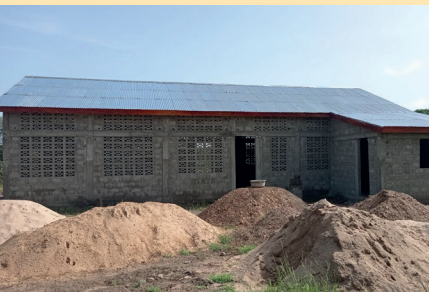
Chantier chapelle d'Agombio / SOKODE