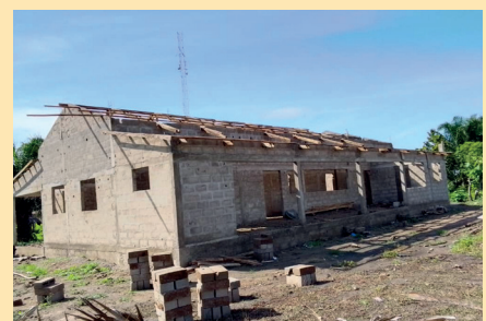
Chantier du Presbytère d'Akaba / ATAKPAME