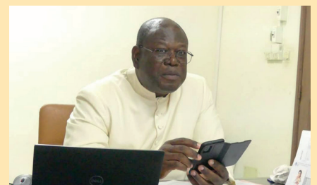
Formateur des agents pastoraux à Ségbé LOME