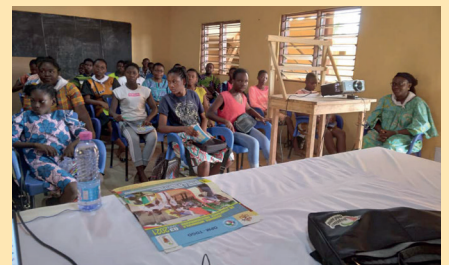
Formation des agents pastoraux à Ségbé LOME