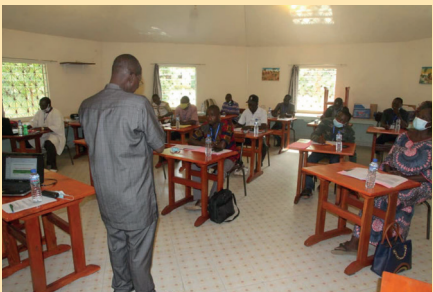
Formation des Médias / SOKODE SIGNIS