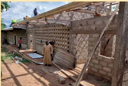
Couvraison du bâtiment scolaire de l'école catholique de Tsavanyan / KPALIME