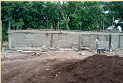
Vue des travaux de construction de presbytère Saint Michel de Klonou / KPALIME