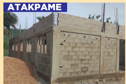
Chantier salle polyvalente Elavagnon / ATAKPAME