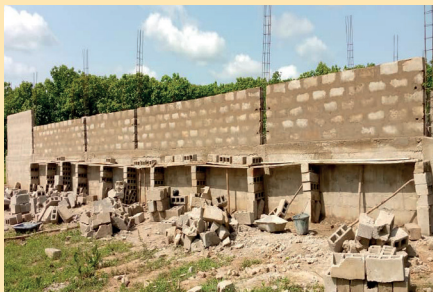
Chantier de la chapelle de banghan / KARA