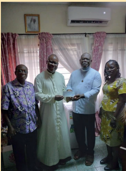
Remise de chèque ....