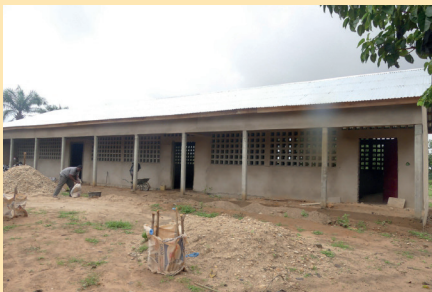
Chantier EPC Tchalo / SOKODE