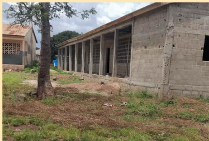
Ecole Primaire Catholique de Ketao / KARA