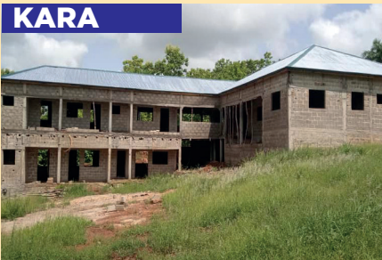
Presbytère Paroisse Saint François / KARA