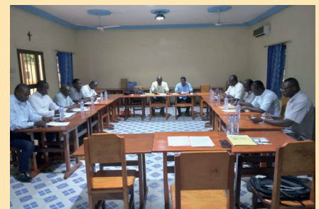
Le réseau en séance de travail / SOKODE