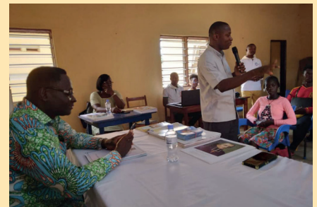
Formation des animateurs des groupes d'enfants à Ségbé LOME