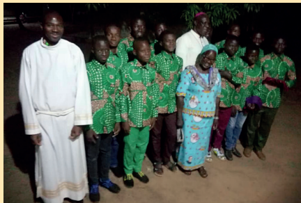
Petit séminaire Saint Clément / DAPAONG