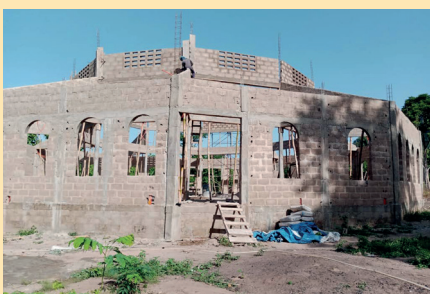
Chantier de l'Eglise d'Ayomé / ATAKPAME