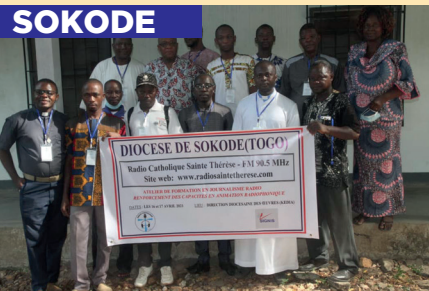
Formation des Médias / SOKODE SIGNIS