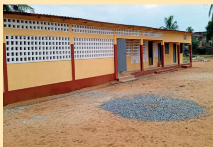
Bâtiment Ecole Dagué / ANEHO