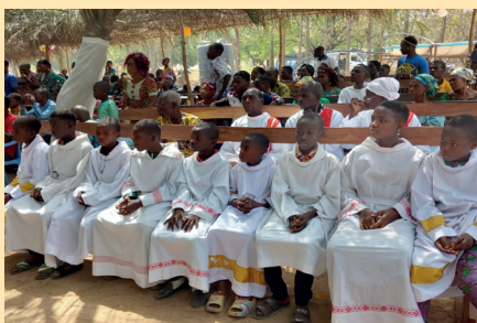
Vue partielle des servants d'autel de la Communauté Sainte Trinité de Bodzé / KPALIME