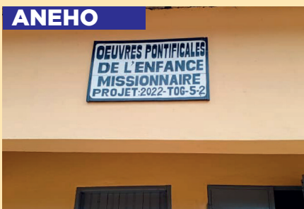
Bâtiment Ecole Dagué / ANEHO